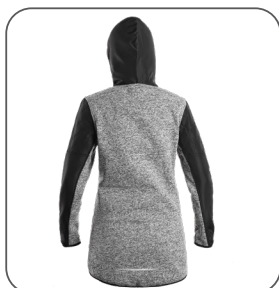
zadní strana back side z tyłu